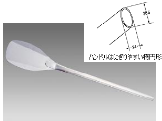
ハンドルはにぎりやすい楕円形