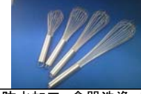
防水加工。食器洗浄、乾燥機OKです。18-8