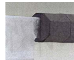
隙間のないハンドル-刀身の接合部