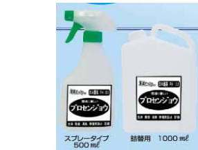
20 プロセソウ [05]