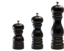
7 ソルトミル ブラウン [M]