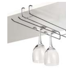
17 アンダーウィングラスホルダー WM-817 [05]