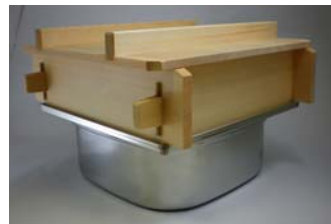
11 PE18-0角蒸し器24cm用水槽 (手無) [M]