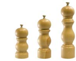
5 ペパーミル ナチュラル [M]