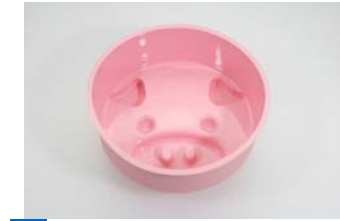
15 デコレーションケーキ型15cm こぶた [10]