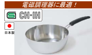
18 スピーネ ゆきひら鍋 [10]