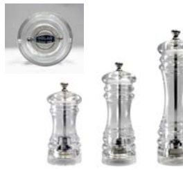
6 ペパーミル アクリル [M]