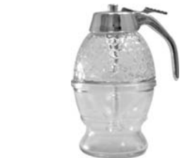
12 MTI ハニーディスペンサー HL20001 [M]