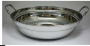
3 MT ステン寄せ蒸し鍋 [M] (水槽兼用)