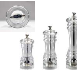
9 ソルトミル アクリル [M]