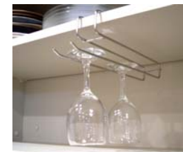
16 食器棚用アンダーウィングラスホルダー WM-664 [05]