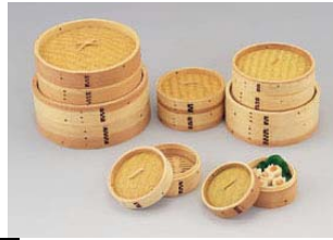
2 MTI 杉中華セイロ 身 [M] (段付)