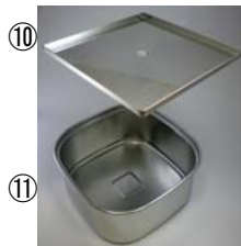
10 18-8蒸し台270mm角 [M] (24cm角水槽用)