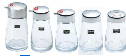
13 フォルマ卓上小物シリーズ [05]