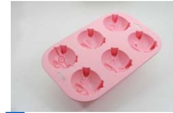
14 6pcマフィン型 こぶた SIL-66 [10]