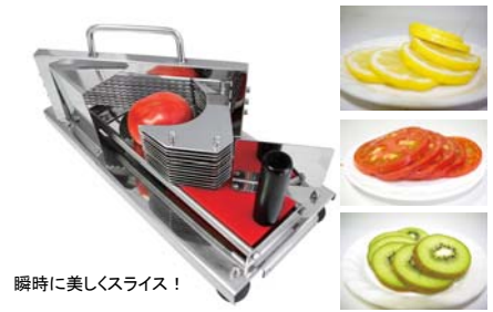
瞬時に美しくスライス!

最大発熱量: 2.3kW(2,000kcal/h) 点火方式: 圧電点火方式 連続燃焼時間: 約90分 ガス消費量: 169g/h