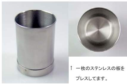
↑ 一枚のステンレスの板をプレスしています。