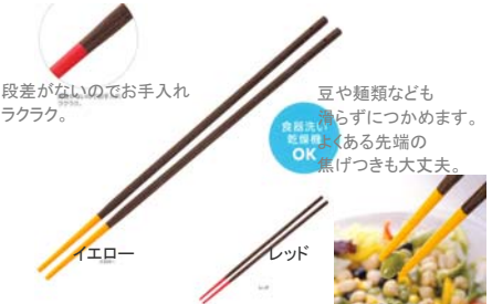
段差がないのでお手入れラクラク。

・2種類の硬度の違うシリコーン製 口に入れた時の感触がやさしく、弾力があります。 ・先端が適度にしなるので、ジャムやベビーフードのビン容器にぴったり沿います。