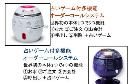
古いゲーム付多機能 オーダーコールシステム 世界初の本体1つで5つ機能 ①お水 ②ご注文 ③お会計 ④呼出し ⑤削除 + 古いゲーム