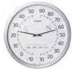
高精度センサー大型温湿度計