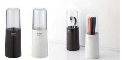
キッチンに調和するシンプルデザイン。

材質: 本体/ソーダーガラス、カバー・スプーン/PP パッキン/シリコンゴム、フタ/AS、トレー/PE