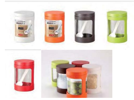
パッキン&スクリュー開閉で完全密閉。湿気を防ぐ調味料ポット

材質: 本体/ソーダーガラス、カバー・スプーン/PP パッキン/シリコンゴム、フタ/AS