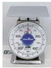
SAVI(サビ)無いシリーズに検定品が登場しました 皿寸法:180×180mm・製品質量:1.5kg