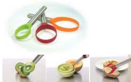
フルーツの他、アボカドなどをくりぬくのにも便利なツールです。

材質:ステンレス鋼・アルミニウム・シリコンゴム 重量:8kg 容量:最高水位/約20L・豆のい線/約10L 付属品:取扱説明書・掃除ピン