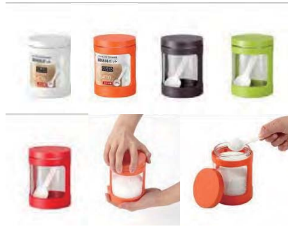
パッキン&スクリュー開閉で完全密閉。湿気を防ぐ調味料ポット

材質: 本体/ソーダーガラス、カバー・中フタ/PP パッキン/シリコンゴム、フタ/AS