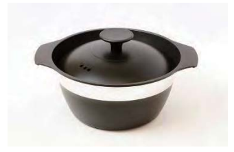
ガスでふっくら美味しいご飯。蓄えられた熱と釜の形が理想的な対流を起こし、ふっくらと美味しいご飯を炊き上げます。