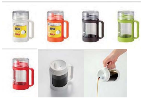
注ぎやすく、液だれしにくい液体用調味料ポット