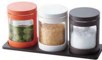
キッチンにコンパクトに設置、軽快に使える新感覚の調味料ポット

材質: 本体/ソーダーガラス、カバー・スプーン/PP パッキン/シリコンゴム、フタ/AS、トレー/PE