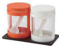
キッチンにコンパクトに設置、軽快に使える新感覚の調味料ポット

材質: 本体/ソーダーガラス、カバー・スプーン/PP パッキン/シリコンゴム、フタ/AS