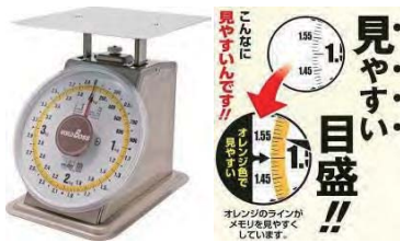
太く大きく見やすい目盛、検定品 取引・証明用 皿寸法:217×217mm・製品質量:2.8kg