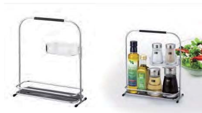
キッチンの調理スペースにすっきり置ける、スリムなフォルム。

材質: 本体・フタ/AS、スノコ/PP、底/AS、PE 衛生的なフード&スノコ付 箸が広がりやすくフードがかぶせやすい。