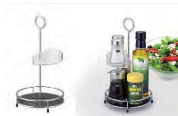
キッチンの調理スペースにすっきり置ける、スリムなフォルム。